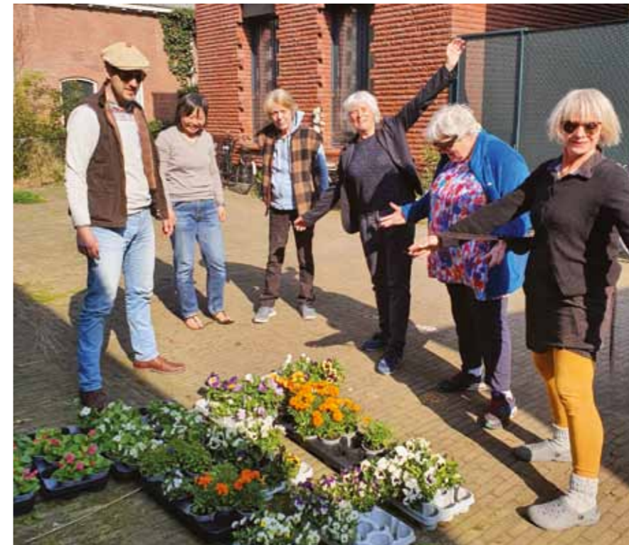
De plantjes zijn naar buiten gehaald en staan klaar voor de Opzoomeraars