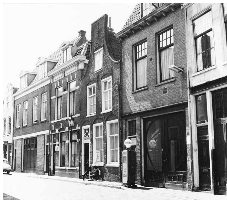
Cinema garage Kilian, daarnaast op 36 Galerie Espace met een tentoonstelling van Karel Appel en op nummer 38 Drukkerij Huizing 1957