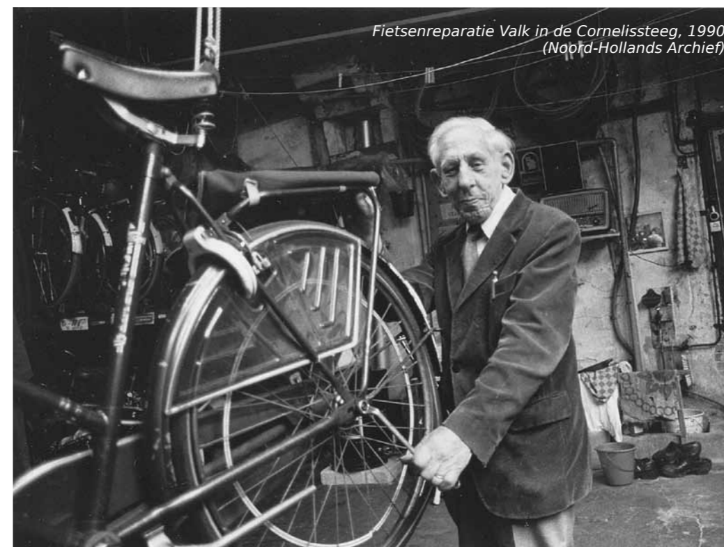
Fietsenreparatie Valk in de Cornelissteeg, 1990

"Op nummer 12 zat Van Goor, de groenteboer. Zijn pakhuis zat in 't