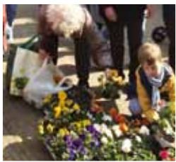
Opzoomeren wordt mede mogelijk gemaakt door Wijkraad Heiliglanden De Kamp.