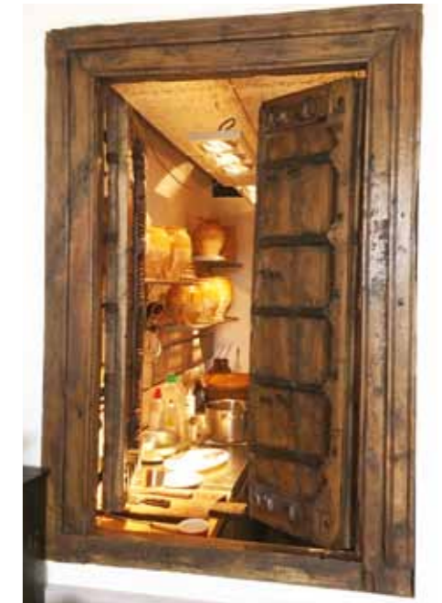
Achter het antieke luik is een deel van de keuken zichtbaar