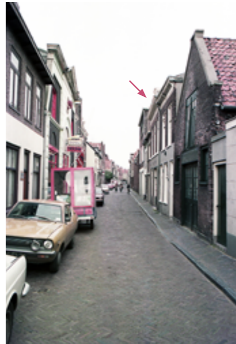
In het huis met de pijl, waar nu de winkel Bradley's zit, was de werkplaats van opa Ben Krom, Klein Heiligland 99