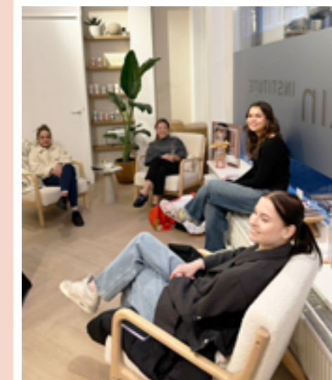
Samen met de laatste gast van deze middag

Meer informatie is te vinden via de link: https://inskin-institute.nl