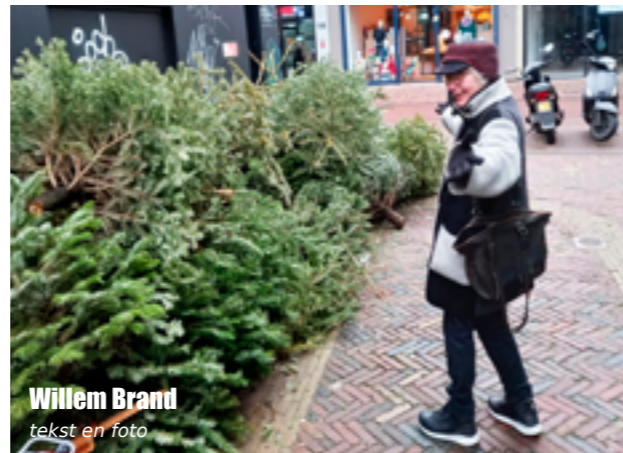
Willem Brand tekst en foto