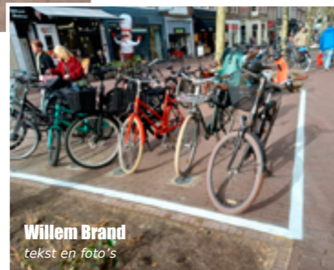
Willem Brand tekst en foto's

Houtplein. Eind februari toen het nog vakloos was, schijnen er boetes te zijn uitgedeeld. In al dat fietsparkeerverbod-geweld zijn we bijna de mooie tuintjes rondom de platanen vergeten. Echt een prachtige aanwinst voor dit zuidelijke deel van de Grote Houtstraat.