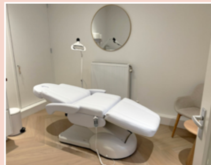
Een van de twee nieuwe behandelkamers