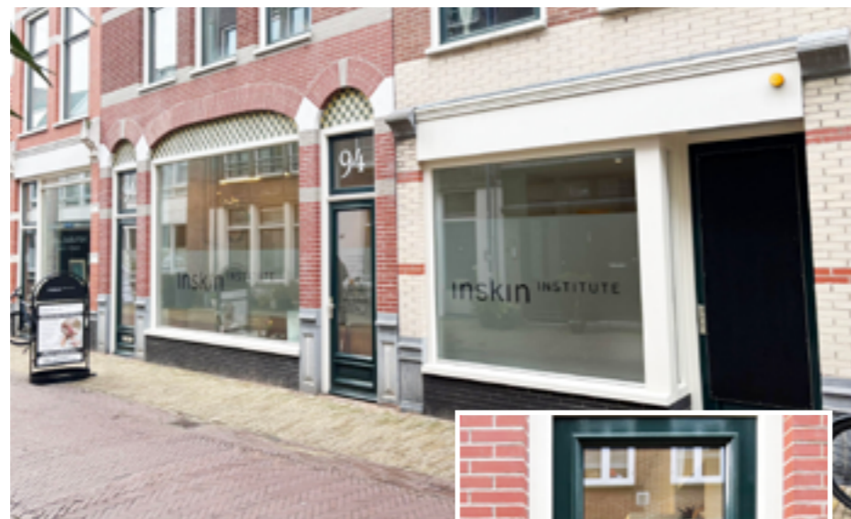
De twee samengetrokken panden van Inskin Institute; op de middelste deur staan de diverse behandelingsmogelijkheden